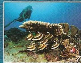
FRED DI MÉGLIO